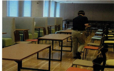
食堂の清掃業務を拝見させて頂きました。(写真右・左)

上長評価と本人評価の二つを実施することでできている所は出来ている、改善が必要な所は上長の評価と本人の評価のすり合わせを行い、マイナス思考で捉えがちな社員も前向きに取り組めるようになったとお話されていました。